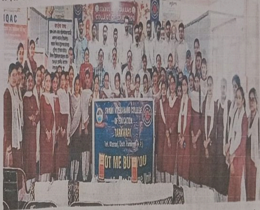
हमीरपुर : कार्यक्रम के उपरान्त प्रशिक्षु सामूहिक चित्र में।