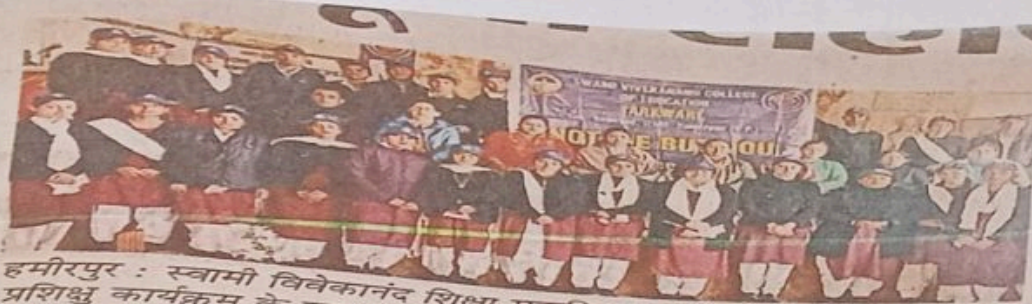
हमीरपुर : स्वामी विवेकानंद शिक्षा महाविद्यालय में एन.एस.एस. यूनिट के प्रशिक्षु कार्यक्रम के उपरांत सामूहिक चित्र में। (राजीव)